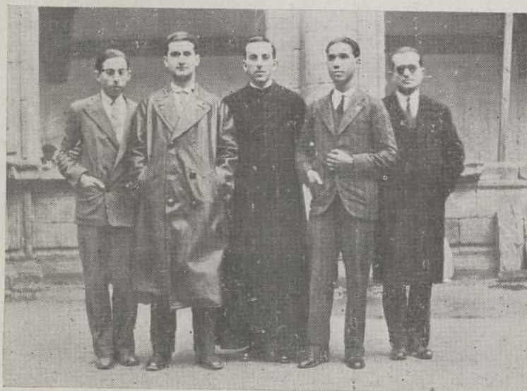
REDACCIÓN de «ABRENTE»