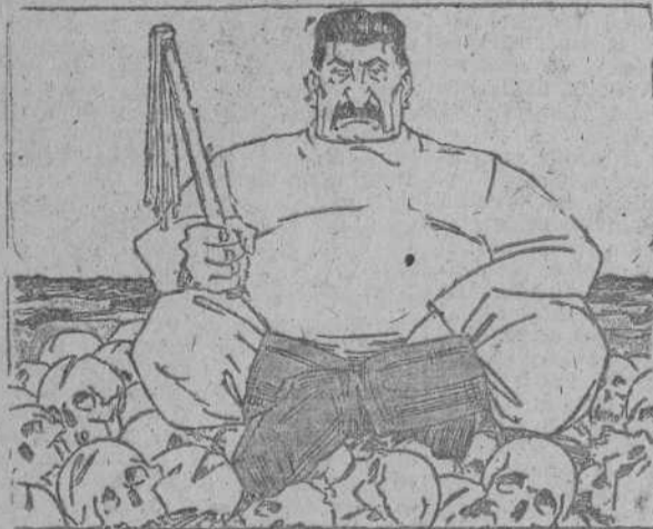
El "zar rojo", que acaba de ser visitado en su guarida por el jefe del Gobierno de S. M. E. y un representante del Presidente norteamericano.

Cada día son mayores las dificultades para abastecer a la U. R. S. S.