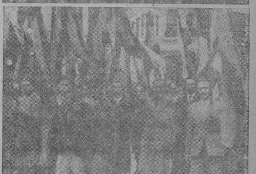
Orden de los grabados; de arriba abajo: S. E. el Jefe del Estado abandona la Casa de la Falange después de celebrado el simbólico acto en el que le fueron entregadas las insignias de la Legión y el emblema con el Yugo y las Flechas. — Representaciones de la Marina y el Ejército que participaron en el brillantísimo desfile. — Camaradas de la Sección Femenina aclamando al Caudillo. — Grupo de banderas de diversos Sindicatos.