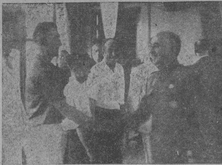
Terminada la gran regata de traineras del domingo, el Caudillo, propulsor y protector supremo de las actividades deportivas de España, estrechó la mano y felicitó a los patrones de las nueve embarcaciones participantes

La Coruña 25 de agosto de 1942. El Primer Jefe accidental.