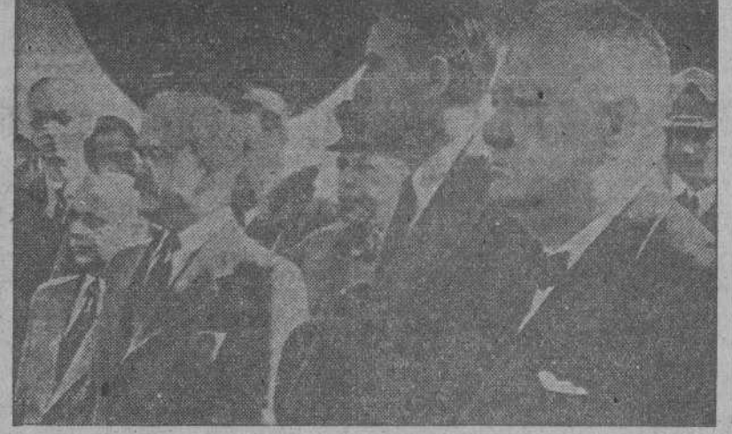
A su llegada a Moscú, Mr. Churchill escucha en el aeropuerto la interpretación de los himnos inglés y ruso. Con el Primer Ministro inglés aparecen en la fotografía, Mr. Averell Harriman, Molotov y el comandante de la plaza de Moscú general Silinov.