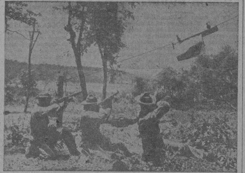
Tres soldados de Infantería de Marina americana, en una base del Sudeste de los EE. UU., disparan contra un blanco que se mueve a razón de 20 pies por segundo, para simular el picado de un avión que ataca a las fuerzas terrestres.

y el establecimiento de un nuevo orden mundial, aumentando todavía más la colaboración con las potencias del Eje y contribuyendo simultáneamente a quebrantar el orgullo de nuestros adversarios.—(EFE).