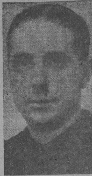
(DE NUESTRA ULTIMA EDICION DE AYER)