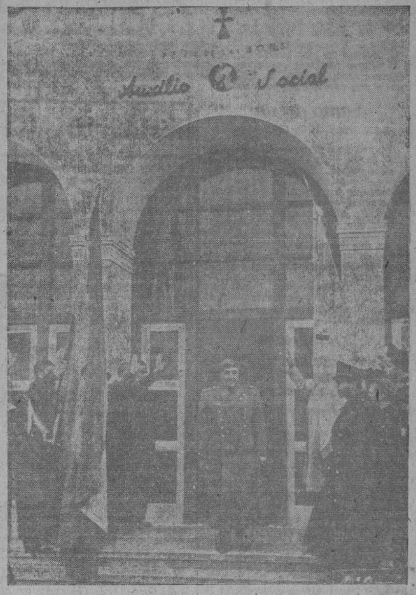
MADRID.—Con motivo del aniversario de Auxilio Social, S. E. el Jefe del Estado, Generalísimo Franco, inaugura una magnífica institución mixta de la benemérita entidad

Formaciones de bombarderos medios y aparatos de la aeronáutica naval atacaron ininterrumpidamente durante toda la noche pasada las posiciones enemigas del sector de combate. Han sido alcanzados importantes objetivos y hemos ocasionado importantes daños. Nuestros bombarderos ligeros, muy activos durante la noche del 31 al 1, continuaron ayer sus ataques muy intensos contra las concentraciones enemigas de la zona de batalla". (EFE).