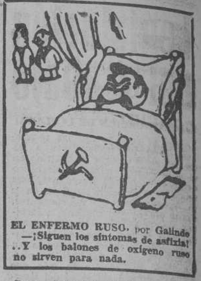
EL ENFERMO RUSO. por Galindo — ¡Siguen los síntomas de asfixia! — Y los balones de oxígeno ruso no sirven para nada.

Para el lavado de mis ojos hago el siguiente cocimiento: Pétalos de rosas, 10 gramos, manzanilla dulce, 10 gramos en 750 gramos de agua. Con este cocimiento que me dura una semana, me lavo los ojos en bañera especial de la que venden en las farmacias, por las noches antes de acostarme y por las mañanas apenas me despierto. Después de bien secos mis ojos, tanto por la noche como por el día, uso esta crema que es maravillosa y cuya fórmula es suya, igual que la del cocimiento para los ojos: Coldrean, 25 gramos; yodol, salol y naftol, un centigramo de cada. Es suficiente una cantidad como la de un grano de trigo para cada ojo, procurando aplicarlo en la raíz de las pestañas. Yo me valgo de un pincel, lino finísimo para extenderlo bien, recuerdo que también seguí su consejo de cortar la punta de las pestañas con una tijerita. Esto lo hice durante seis meses consecutivos, haciéndolo solamente una vez por mes. A partir de entonces empezaron a desarrollarse de este modo extraordinario que Vd. ve. Aquí terminan las confidencias que me hizo esta preciosa muchacha española cuyo mayor encanto estriba en el abanico espléndido de sus largas pestañas. Y la he agradecido muchísimo que se acuerde de que, gracias a mis recetas lo consiguió. Espero que mis queridas lectoras no quedarán defraudadas si tienen la constancia que es preciso para lograr ese hermoso encanto de unas pestañas maravillosas. (Colaboración LOGOS)