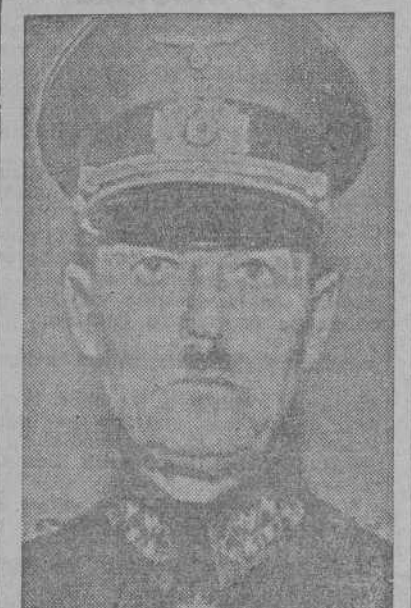
El general von Rundstedt jefe de las fuerzas alemanas de ocupación de Francia

LONDRES 13.—El cuartel general interaliado declara que las fuerzas