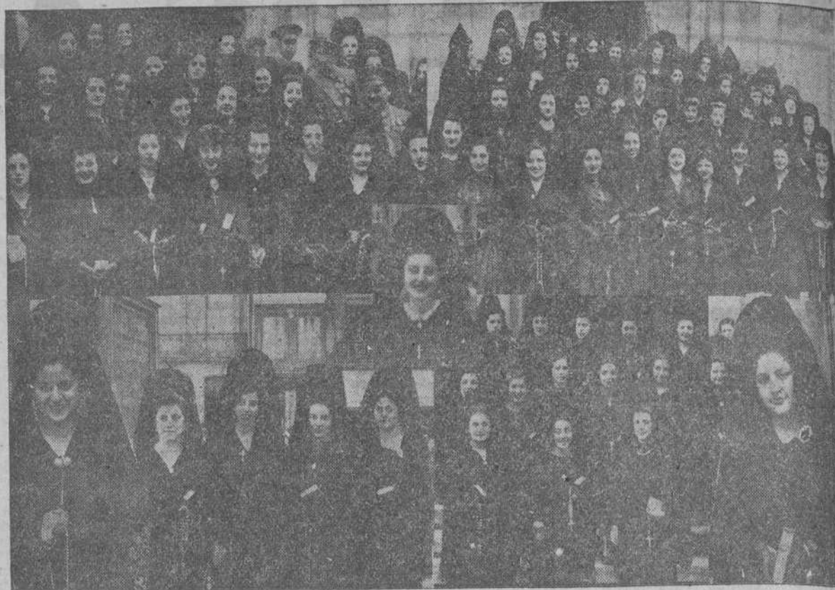
ALGUNAS DE LAS MUCHAS SENORITAS CORUNESAS QUE ASISTIERON A LOS SOLEMNES CULTOS DE JUEVES Y VIERNES SANTO LUCIENDO LA CLASICA MANTILLA ESPAÑOLA