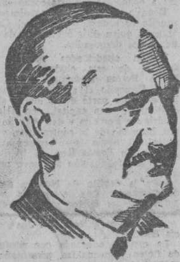
Excmo. Sr. D. Alfonso Peña, Ministro de Obras Públicas

ellos dedicaremos durante el año actual preferencia absoluta. Según los cálculos menos optimistas, podremos inaugurarlos totalmente terminados antes de acabar el año 1945. Este presupuesto extraordinario pasa de los mil millones de pesetas que, como es lógico, los invertiremos en los dos años, 1944 y 1945. EL FERROCARRIL CALATAYUD-SANTANDER Sobre el ferrocarril Calatayud-Santander, dice el ministro: Estas obras también van incluidas en el mismo presupuesto. Si se ha avanzado con menos rapidez de la que esperábamos, se debe a la excavación del túnel de bajada a Santander, que tiene nueve kilómetros de longitud y tiene que ser perforado en la roca viva. Además de éste se están realizando otros tres túneles más en esta misma línea. Otra de las obras más importantes realizadas en relación con Santander la constituye la estación única en la capital montañesa, utilizable por todos los ferrocarriles que afluyen a ella. (CONTINUA EN TERCERA PLANA)