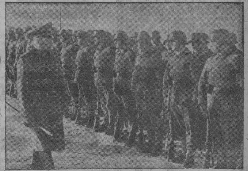
En nuestra fotografía vemos al célebre mariscal alemán revisando la Unidad que lleva su nombre