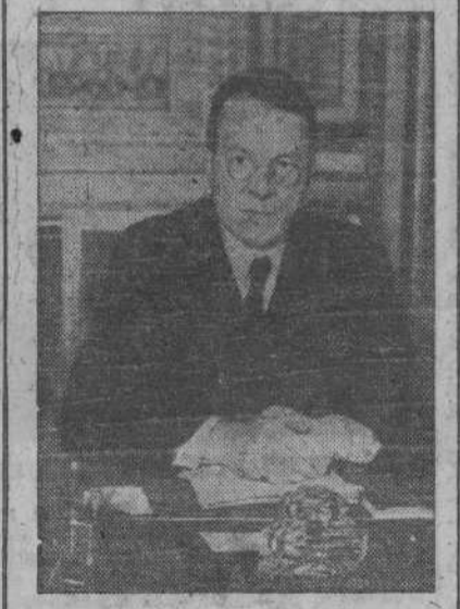
El Ministro de Asuntos Exteriores sueco, señor Gunther, uno de los aliados de la Paz