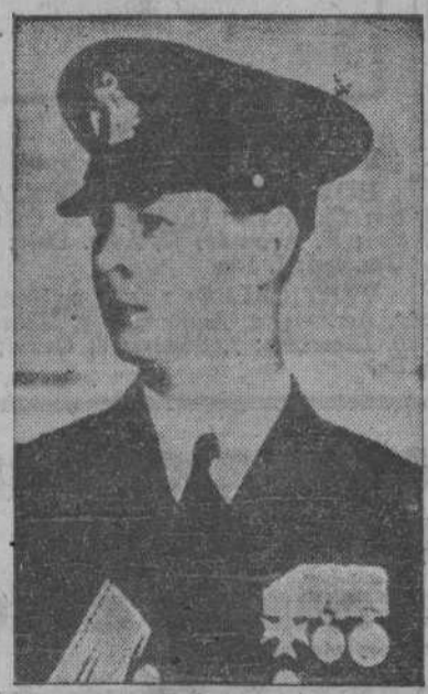
El Rey Miguel de Rumania

ANGORA, 24.—La Legación de Rumania en la capital turca ha confirmado hoy que las tropas alemanas han ocupado Rumania. La Legación no ha facilitado más detalles.—(EFE).