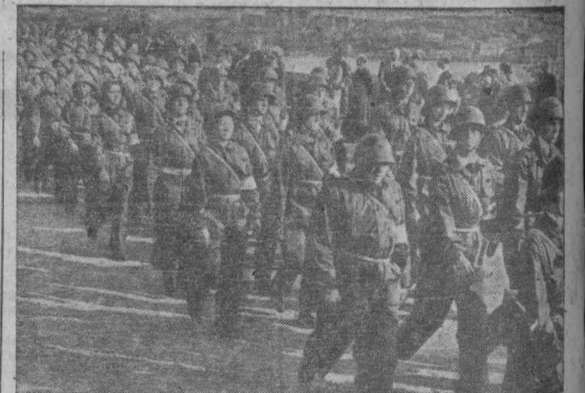
Voluntarias de la defensa pasiva sueca haciendo maniobras de entrenamiento