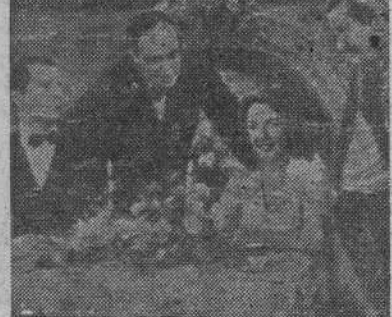
UNA ESCENA DE LA PELICULA