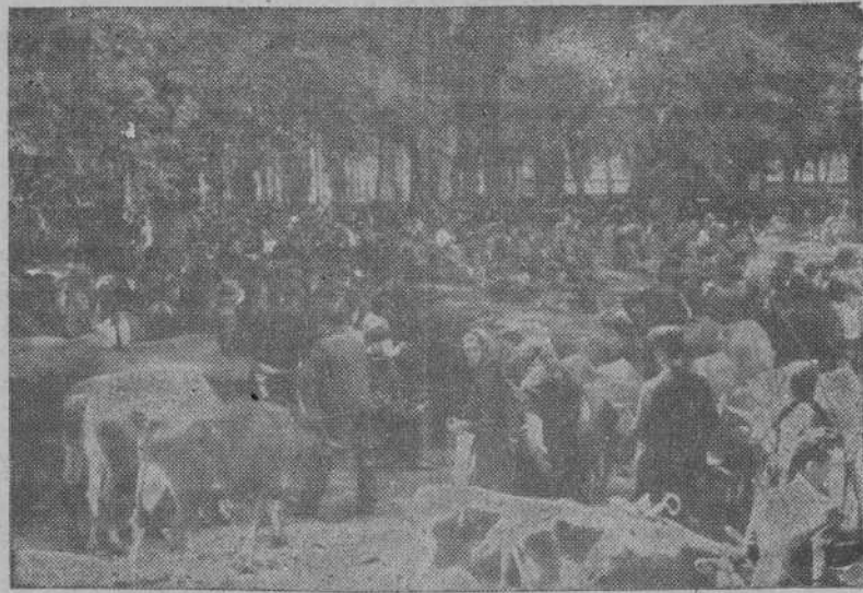
La riqueza ganadera de Galicia ocupa el primer lugar de toda la producción española. No obstante, puede lograrse un resultado más beneficioso aún si se modifican los sistemas de explotación, problema que va a ser estudiado en el Congreso Agrícola de Santiago

agricultor, que en su inmensa mayoría utiliza en su labor anticuados procedimientos y desatiende sugerencias modernas, de probada eficacia en los métodos de siembra. Hay todavía en Galicia extensísimas superficies de terreno improductible, que reúnen envidiables condiciones de cultivo y de importante producción.