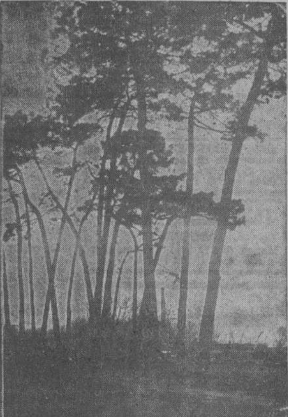
Pinos centenarios de la bella campiña gallega