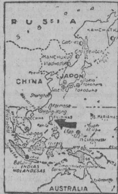
Las islas Filipinas, en la zona ya vital para el Japón

En Tacloban centenares de filipinos organizaron una manifestación que recorrió las calles de la capital, engalanada con banderas en honor de los soldados norteamericanos.