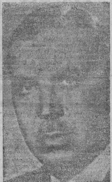
Don Miguel Mateu

de embajadores, y al finalizar el año 1938, ministro plenipotenciario y enviado extraordinario en Venezuela. El año 1943 fue en calidad de embajador extraordinario a Venezuela, para asistir, en representación de España, a las ceremonias que allí se celebraron. En junio de (CONTINUA EN TERCERA PLANA)