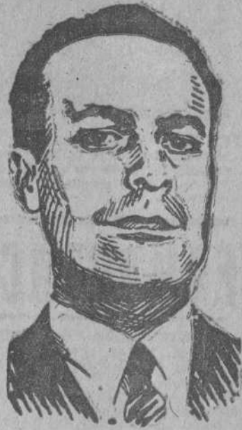
Excmo Sr. D. Blas Pérez, Ministro de la Gobernación

Hebrá también colonias silicóticas con la ayuda económica del ministerio de Trabajo y del ministerio de la Gobernación.