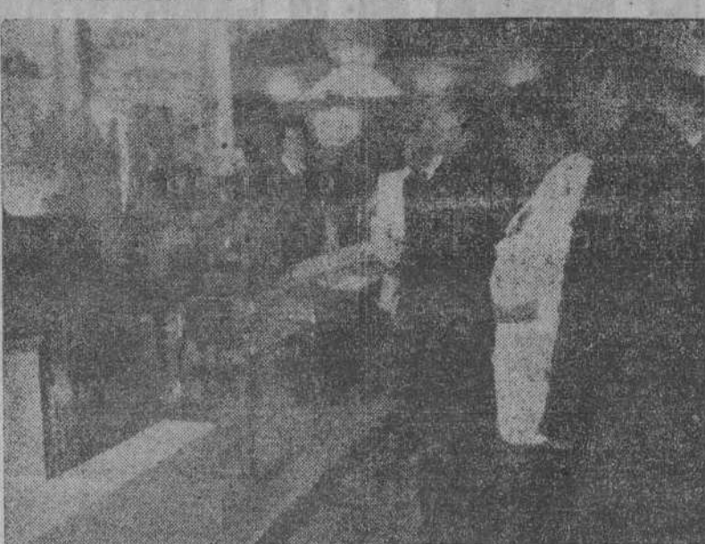
En Madrid fué inaugurada, en nombre de S. E. el Jefe del Estado, por el Ministro Secretario, la Exposición de Industria Eléctrica...