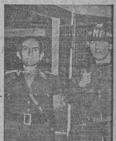
El general Hans Goebbels (izquierda), hermano de Joseph Goebbels, después de su captura por las tropas del primer ejército norteamericano.