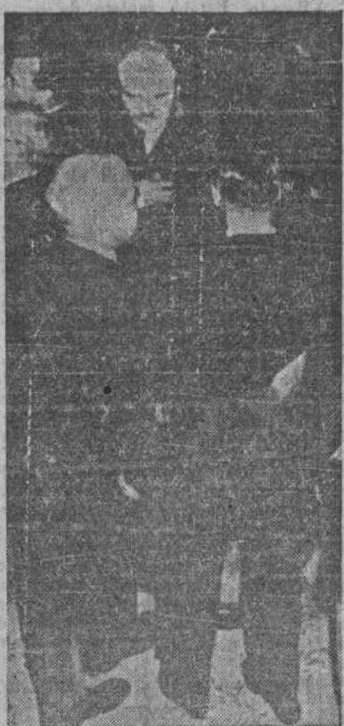
El Secretario de Estado norteamericano, Edward R. Stettinius, rodeado con su brazo al Ministro inglés de Asuntos Exteriores, Anthony Eden, conversa con el Comisario ruso Molotov durante un descanso de la cuarta sesión plenaria de la Conferencia de San Francisco.