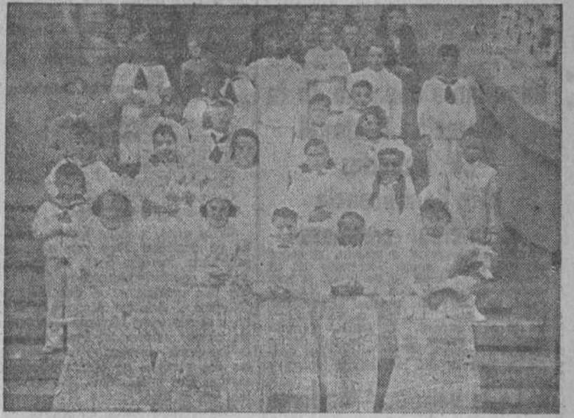
Arriba: Niños y niñas que reciben instrucción en el Grande Obra de Atocha y que ayer, festividad de la Ascensión, hicieron la primera Comunión, en la capilla de dicha entidad benéfico-religiosa.—Abajo: Alumnos de la catequesis de la parroquia de Santa Lucía que recibieron el Pan de los Angeles