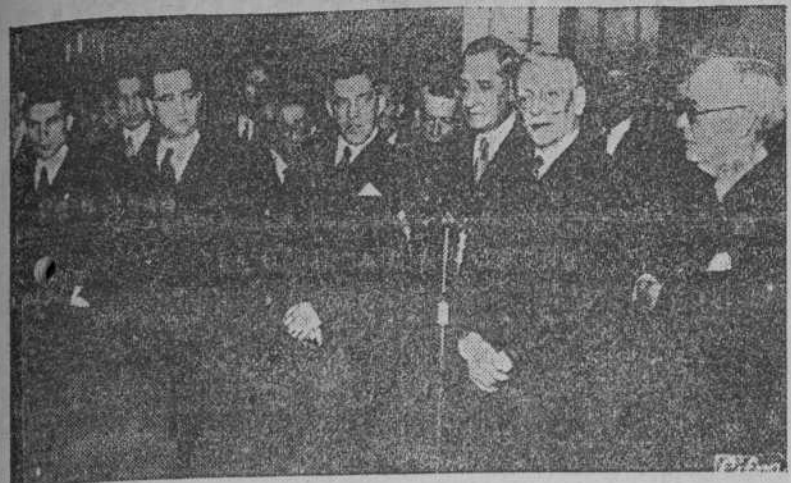
El Presidente de la República portuguesa, general Carmona, con motivo del homenaje que le tributaron las delegaciones de todo el país, se dirige por radio al pueblo portugués. (Foto CIFRA).

Se organiza un desagravio al saineiro valenciano, Escalante. Había sido robado el busto erigido en su honor.