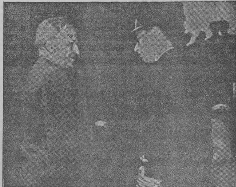
El Presidente Truman conversando con el Rey de Inglaterra a bordo del "Augusta" durante su reunión en el puerto de Plymouth