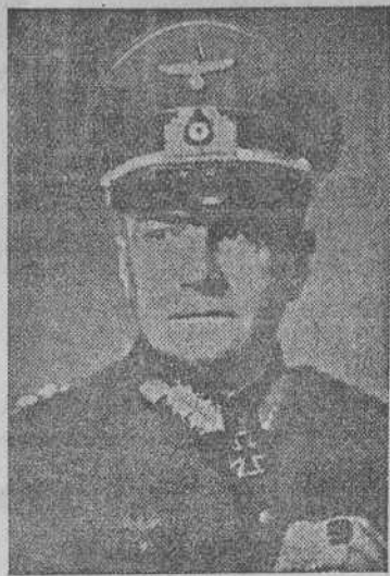
"Bismarck (Ministro alemán en Roma) comunica que ha sido destituido von Brauchitsch (jefe supremo de la Wehrmacht)..."

19 de diciembre.—"Siguen siendo malas las noticias procedentes de Libia, niñesto con el tono arrogante que ha caracterizado sus discursos hasta ahora..."