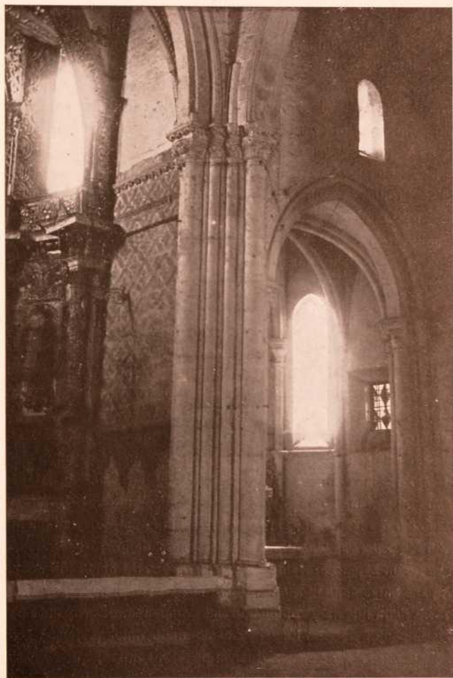
Columna del arco triunfal de Santo Domingo

yendo vigas, pontones y tablas para el techo y los pisos; todo lo cual se hizo con fondos de la Comunidad, excepto dos mil ciento ochenta y nueve reales que se juntaron de limosnas, según resultado del libro de cuentas de la obra.