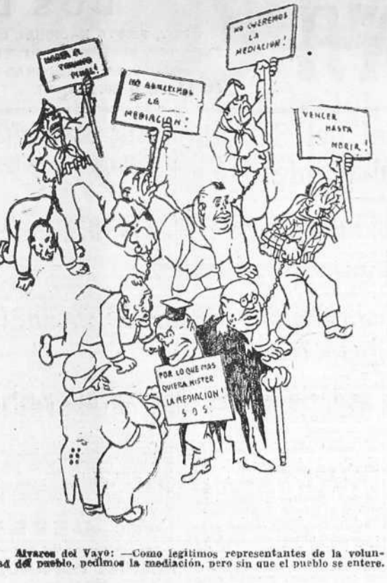
Alvarez del Vayo: Como legitimis representantes de la voluntad del pueblo, pedimos la mediación, pero sin que el pueblo se entere.