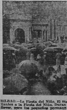
BILBAO.—La Fiesta del Niño. El mal tiempo no consiguió restar brillantez a la Fiesta del Niño. Durante la Misa de Campaña comenzó a llover, pero los pequeños permanecieron en sus puestos hasta terminar la ceremonia. Los niños en la Misa de Campaña.

¿Qué es el dinero? El director de una vieja y acreditada casa de banca recibe una vez en Londres la visita de un caballero que abre ante sus ojos una maleta conteniendo docientos mil libras en diversos valores. Se verifica minuciosamente estos valores, fuerte y se le da un resguardo al portador, quien comienza a extender cheques contra la casa de banca. Diversas industrias son puestas en movimiento; el comercio recibe un nuevo impulso; se reduce el paro y mejora el nivel de vida de muchísimas personas; pero, desgraciadamente, al director del banco se le ocurre un día echarle una ojoada a la maleta. ¡Nunca lo hubiera hecho! Robo o estafas? ¡Lo cierto es que la maleta aparece vacía y todo se viene abajo de un golpe. ¡Y pensar que, con la maleta cerrada, hubiese habido un bienestar y prosperidad por muchísimo tiempo! Nadie sabe a ciencia cierta lo que es el dinero. En Julio del treinta y seis los rojos se apoderaron de todo lo que había en España y anunciaron a los cuatro vientos que nos iban a ganar la guerra. —¿Qué puedan hacer contra nos-