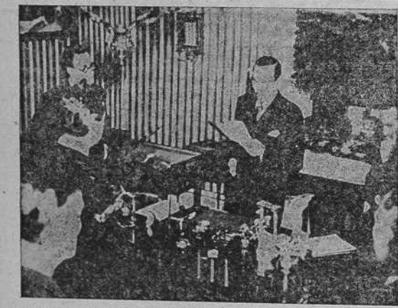
El Conde de París, heredero del Trono de Francia, en el momento en que leía a los periodistas su importante declaración sobre el estado de Francia, hecho que, como se sabe, lo realizó quebrantando la prohibición de entrar en tierra francesa.

Debels de sumarnos al no habéis hecho ya a los que contribuyen con sus donativos en metálico o especies con destino al Auxilio a Poblaciones Liberadas. En Real 76, entrega los papeles para aquel fin patriótico.