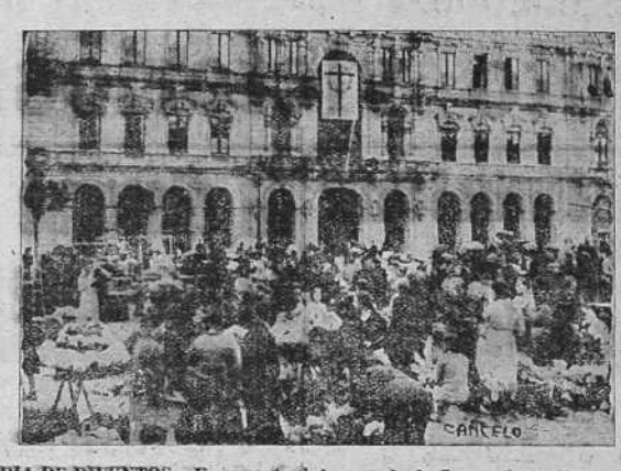
DIAS DE DIJUNTOS.--Un aspecto del mercado de flores, efectuado ayer en la Plaza de María Pita

A partir de hoy, día 1, sufrirán modificaciones, en la llegada, el tren expreso, y en la salida, el de Ferrol.