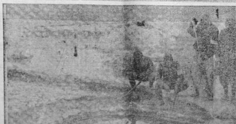
Los japoneses se detienen en las salinas de Yanchen durante su progresión en el Chansi

ORO Y DINERO PARA LA PATRIA. ¡RICOS! EL EGOISMO ES HERMANO DE LA TRAICION