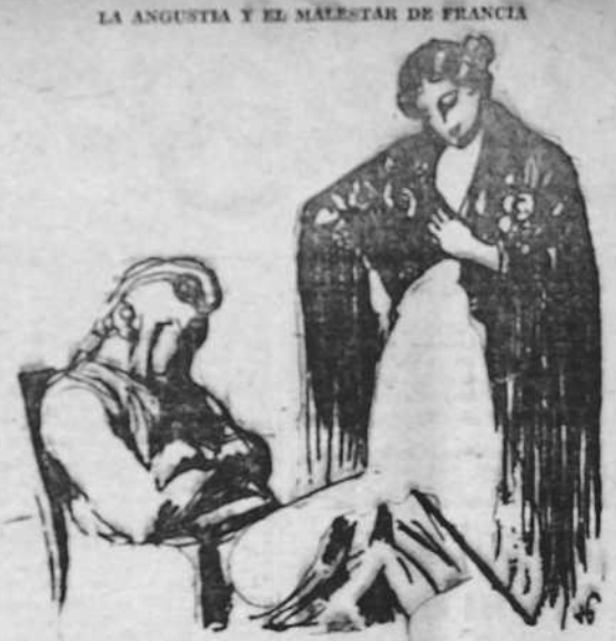
España: —Quitate ese zorro frío y véis cómo te encuentras en seguida mejor. (Lo mismo me ocurrió a mí. Oe "Je Suis Partout").