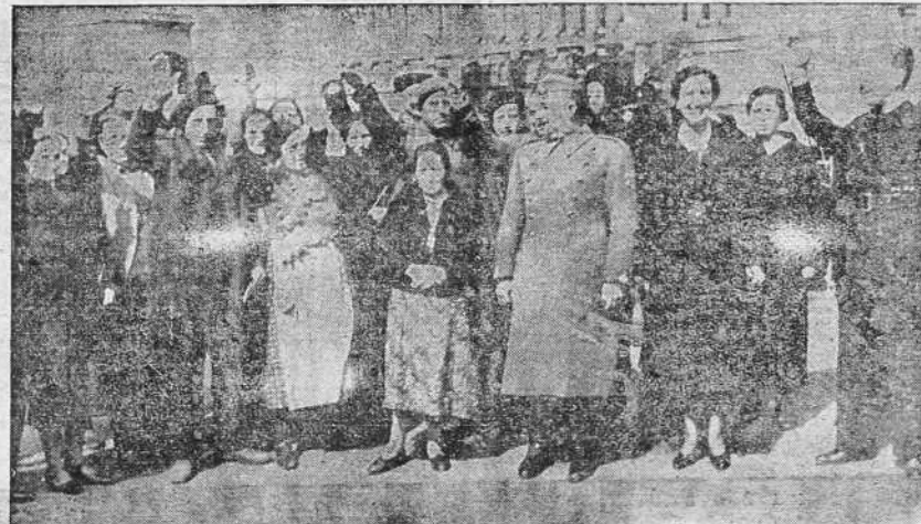
El Generalísimo Franco ha entregado personalmente los primeros subsidios a los treinta y siete matrimonios—uno por cada provincia liberada—con mayor número de hijos menores de catorce años, beneficiarios del "subsidio a familias numerosas" creado por el nuevo Estado. El Generalísimo Franco, con su esposa, doña Carmen Polo, y el Ministro de Organización y Acción Sindical, señor González Bueno, rodeados de un grupo de los matrimonios beneficiarios del subsidio a familias numerosas.

ban de poner "chinitas"; hoy son los camiones, mañana es un barco, otro día son los presos. Sin embargo, con o sin su gusto, nuestro rumbo está trazado por el genio de nuestro Caudillo. Confiados todos los españoles en su acierto, colaboremos entusiastas en su magna empresa, que es la nuestra y de España. Tiempo tendremos de sobra para ver después en qué para esta nueva fase de la crisis europea. MANUEL GRANA.