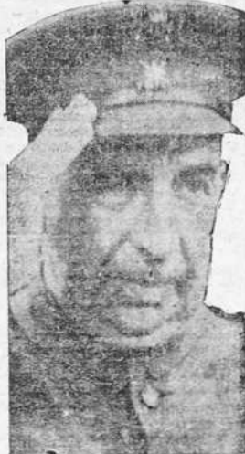
General Orcaz, jefe del Ejército de Levante

soldados del invicto Generalísimo Franco. ¡Arriba España!