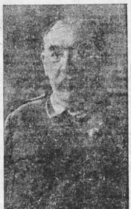
General Saliquet, jefe del Ejército del Centro

Radio Tenerife también ha comunicado durante toda la noche y el día de ayer con las emisoras de Cuenca y Ciudad Real. La radio de esta última capital comunicó que los elementos falangistas, ayudados por los guardias de Asalto y los elementos de orden de la población civil, se habían apoderado de todos los edificios públicos de la ciudad y dominaban por completo la situación. La estación de Cuenca decía: —Cuenca, el pueblo entero, espera con delirante júbilo su amanecer en la España de Franco. En estos momentos la emoción de todos los cuencenses es enorme. Aguardamos impacientes a los