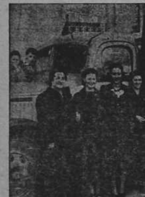
Señoritas que prepararon los paquetes de Auxilio a Poblaciones liberadas destinados a los habitantes de Madrid