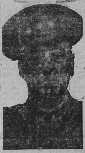
General don José Moscardá, jefe del Cuerpo de Ejército de Aragón