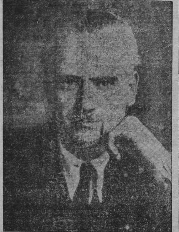
Excmo. Sr. D. Ramón Serrano Suñer, ministro de la Gobernación