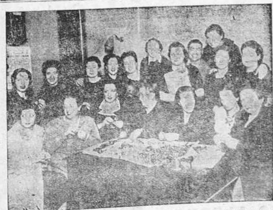
Las señoras y señoritas de la Delegación Provincial de Asistencia a Frentes y Hospitales, preparando los servicios para los combatientes que han liberado a Madrid

Todos estos buques mercantes llegaron a Francia conduciendo a cabecillas rojos que huyeron de España al acercarse las tropas nacionales a sus respectivas capitales y pueblos. De esta forma burlaron la justicia de Franco los que han cometido numerosos crímenes y robos.