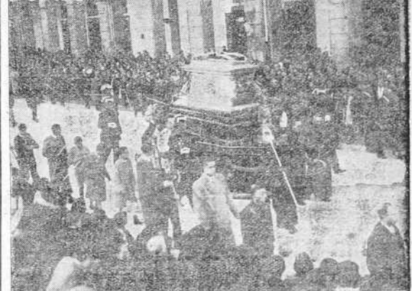
El Santo Sepulcro, a su paso por las calles de la capital, en la procesión del Santo Entierro, celebrada ayer tarde