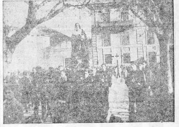
Otro aspecto de la procesión del Santo Entierro, al pasar por la Plaza del Neng al Franco