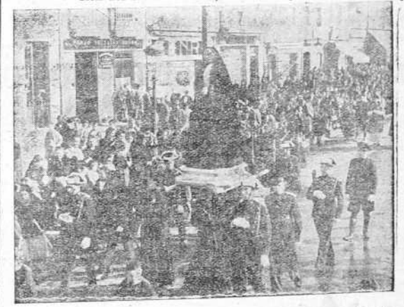
La imagen de la Virgen de los Dolores que figuró en la procesión del Encuentro, verificada en la mañana de ayer