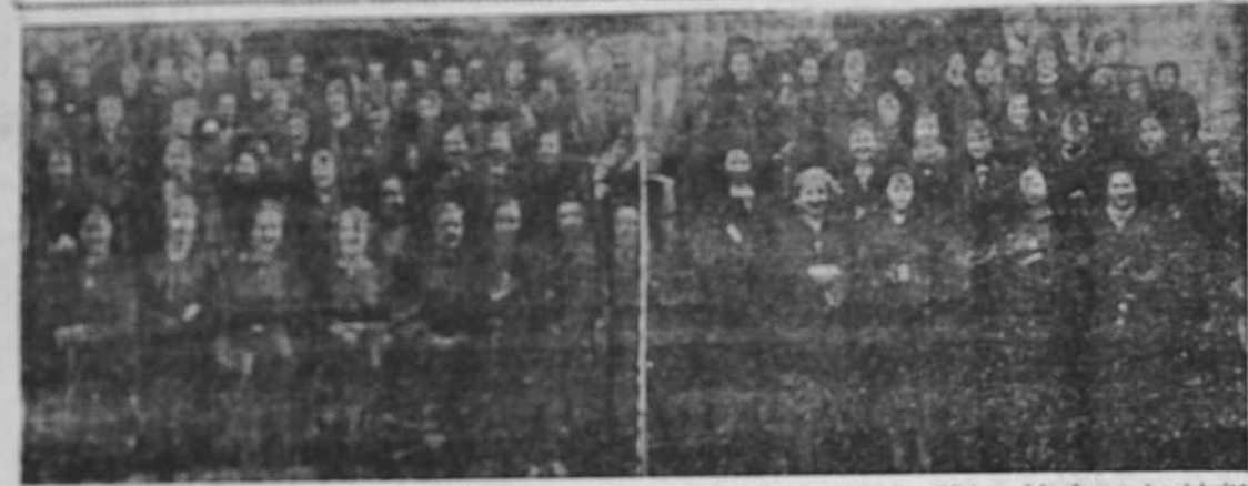
Grupo de voluntarios gallegos que, al igual que la oficialidad española, asistieron a los Divinos Oficios celebrados en las Iglesias parroquiales de Santa Lucía y Santiago