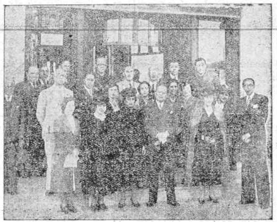
Los excursionistas argentinos llegados ayer a La Coruña, con los miembros de la Junta directiva del Centro Ibero Americano, que acudieron a esperarlos.

BERLIN, 1.—Ocupándose del regreso de los voluntarios de la Legión "Condor", de España, la "Correspondencia Política y Diplomática" señala el orgullo con que en Alemania se ha acogido el regreso de aquellos soldados, que fueron a luchar por ideales y no por deseo de preponderancia política. Añade que esto viene a poner fin a las propagandas hechas por algunos países de que Alemania perseguía ambiciones territoriales, con el único fin de perjudicar el buen nombre de las potencias del Eje y hacer perder la confianza en ellas. Hoy los hechos vienen a demostrar—sigue el periódico—que España luchó por su independencia, lograda con tanta sangre y a nosotros nos cabe la satisfacción de haber estado a su lado en esta victoria.