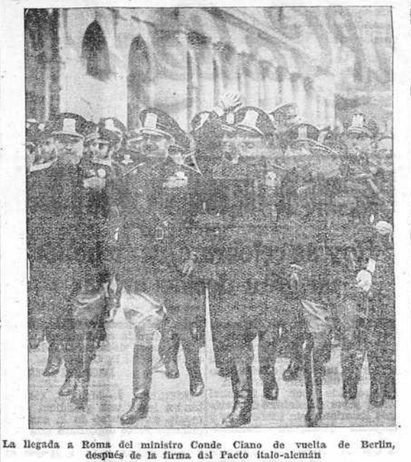
La llegada a Roma del ministro Conde Ciano de vuelta de Berlín, después de la firma del Pacto italo-alemán

SE VENDE comedor, alcaña de matrimonio, perchero y otros muebles. Razón: Estrella, 25-27, Horas de 4 a 8.