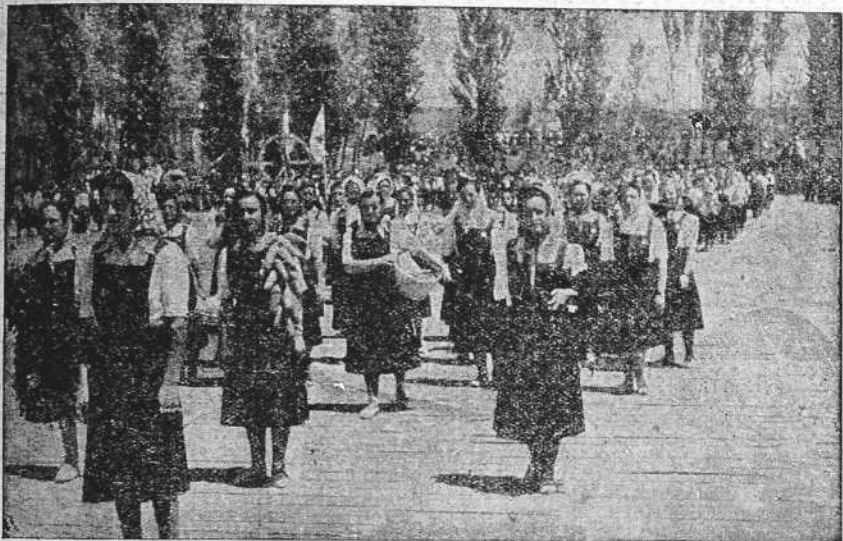
Diez mil afiliadas de la Sección Femenina de Falange Española Tradicionalista han rendido homenaje al Caudillo y al Ejército, en Medina del Campo. Un grupo de muchachas riojanas al pasar ante la tribuna del Caudillo para hacerle ofrenda de los productos de su región.