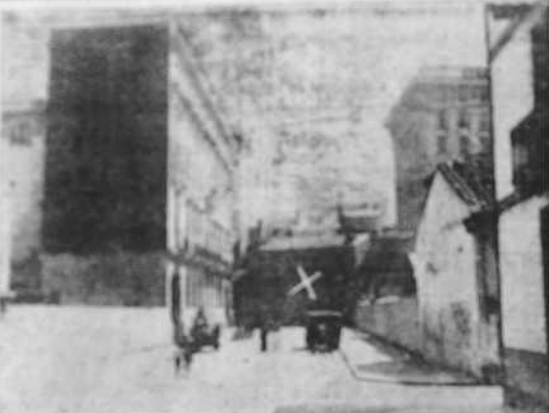
El Ayuntamiento acordó hace pocos días proceder a la demolición de las casas que interrumpen el acceso entre las calles de Santa Catalina y de Durán Llerda. Nuestra fotografía muestra la última de estas casas, situada a la izquierda el Palacio de la Delegación de Hacienda, y al fondo, la casa que se proyecta derribar.

TU ORO DEBE SER PARA LA PATRIA BARCELONA, 7. —Se han celebrado las pruebas eliminatorias para el campeonato de tenis.