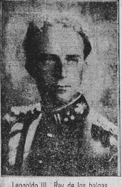
Leopoldo III, Rey de los belgas

Las tropas acogen con satisfacción la actitud de su Rey; el Gobierno acuerda —:— proseguir la resistencia —:—