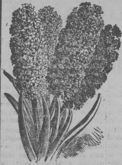
Jacintos dobles de Holanda

Arboles frutales y de adorno para Jardines y Macetas