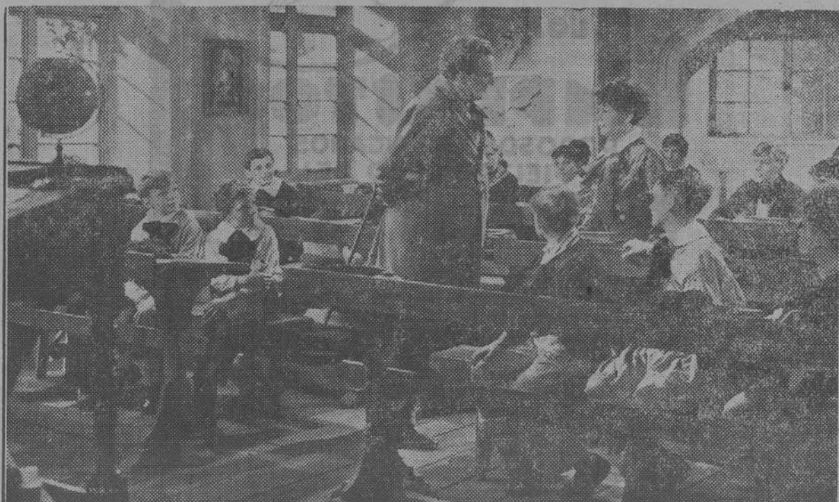
Una de las bellísimas escenas de la producción B. I. P. «Al llegar la Primavera» que distribuye la entidad valenciana «Cifesa».

La noticia no es imaginaria. Ese país existe. Por lo menos fué montado para la filmación de "Había una vez dos héroes..." la producción de la Metro-Goldwyn-Mayer que supera en lujo, en belleza, y sobre todo en comicidad a "Fra Diavolo".