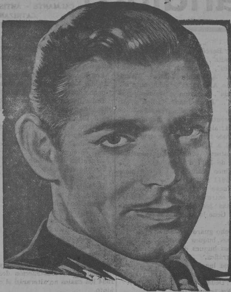
Clark Gable, el famoso galán americano, protagonista del delicioso film de Cifesa «Sucedió una noche».