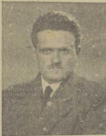
Don Alvaro d'Ors

Primera etapa de aquel proceso.—Hace 20 años se dedicaba el conferenciante al estudio de los Concordatos. Vió que un Concordato es un pacto. Pero los tipos de pacto son dos: el que se realiza dentro de un Estado, que tiene como sanción superior el proceso, y el interestatal, que carece de sanción superior, si no se considera como tal la guerra.