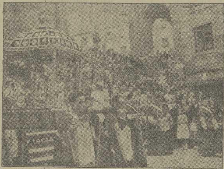
La reliquia del Santo Apóstol, portada por Capellanes, en la procesión del Patronato

Es verdad que todos los días llegan hasta él las fervientes alabanzas y las rendidas súplicas de la Iglesia Compostelana, feliz y celosa