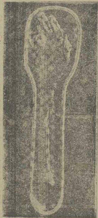
Reliquia del brazo derecho de San Francisco Javier, cuyo cuarto centenario se celebra, expuesta a la veneración de los fieles en el castillo de Javier (Navarra)

El IV Centenario de San Francisco Javier