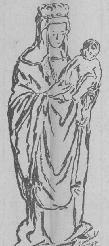
Una Virgen románica entre las muchas de nuestra tierra, que hablan de la multiseccular devoción mariana del pueblo gallego.

cel o a los campos de concentración, el tan deseado regreso a la patria para todos aquellos que todavía están prisioneros... para aquellos que están ciegos en el cuerpo y en el alma, la alegría de la refulgente luz, y que a todos os que están divididos entre sí por el odio, la envidia y la discordia, les obsequen por sus súplicas la caridad fraterna, la concordia de los ánimos y aquella fecunda tranquilidad que