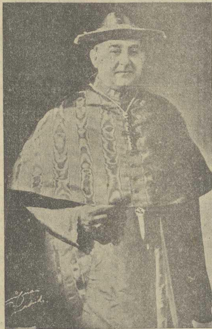
E' ULTREYA felicita jubilosamente en esta fecha al Emmentísimo Prelado.