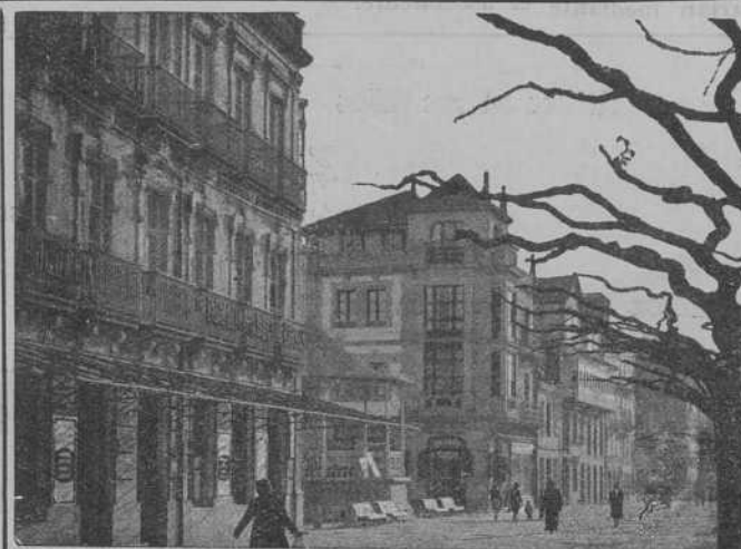
TUY.-Perspectiva de la Corredera, principal arteria comercial de la Ciudad.

Finalmente se expresa la esperanza de que en la nueva etapa ministerial se reconsidere este asunto".