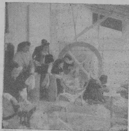
Estampa Velazqueña.- Fiadeiras de Túy traballando no liño.

"...de ferro ou madeira nem d'outra coisa grosseira se não de braços de irmãos", dijo el poeta.