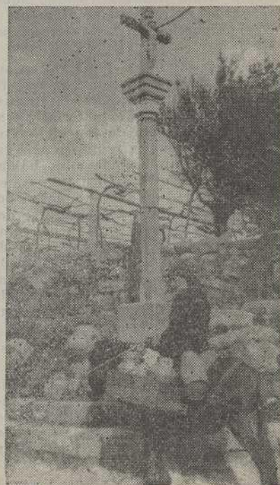
Volta da Vila.-A leiteira descansa no cruceiro de Malvas.