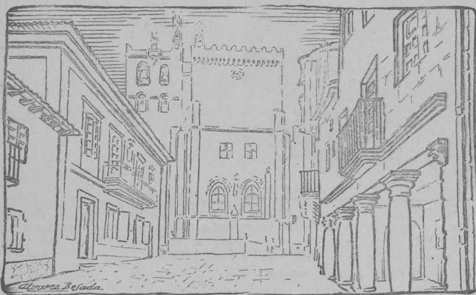
TUY.-Antigua estampa de la Plaza de la Constitución, con el Campanil románico y la Torre del Homenaje de la Catedral

La cortedad de espacio al cierre de esta edición, no nos permite comentar más ampliamente la consecución definitiva de esta vieja e indispensable aspiración de la ciudad, sin la cual hablar de turismo aquí equivaldría a sentar la realidad de un mito.