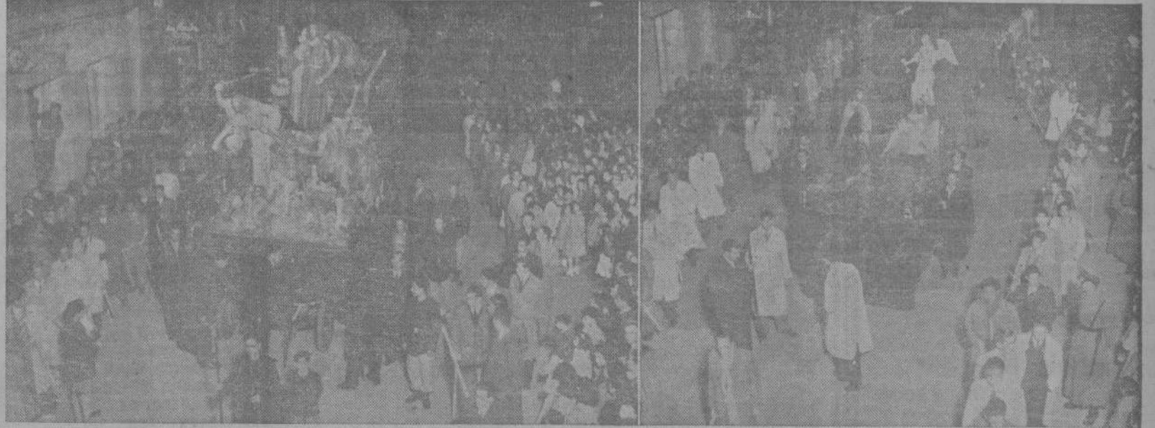
DOS INSTANTANEAS DE LA PROCESION DEL DOLOR, ORGANIZADA POR LA HERMANDAD DE SAN JUAN EVANGELISTA Y QUE ANOCHE RECORRIÓ LAS PRINCIPALES CALLES DE LA CORUÑA ENTRE EL EMOCIONANTE Y FERVOROSO RECOGIMIENTO DE LA MULTITUD ESTACIONADA EN EL TRAYECTO. (Información en la página cuatro).

LA HABANA, 19.—Don Nicolás Rivero Alonso, Conde de Rivero, ha fallecido a consecuencia de una angina de pecho. Desempeñó los cargos de Embajador de Cuba en Uruguay y el Vaticano.—(EFE).