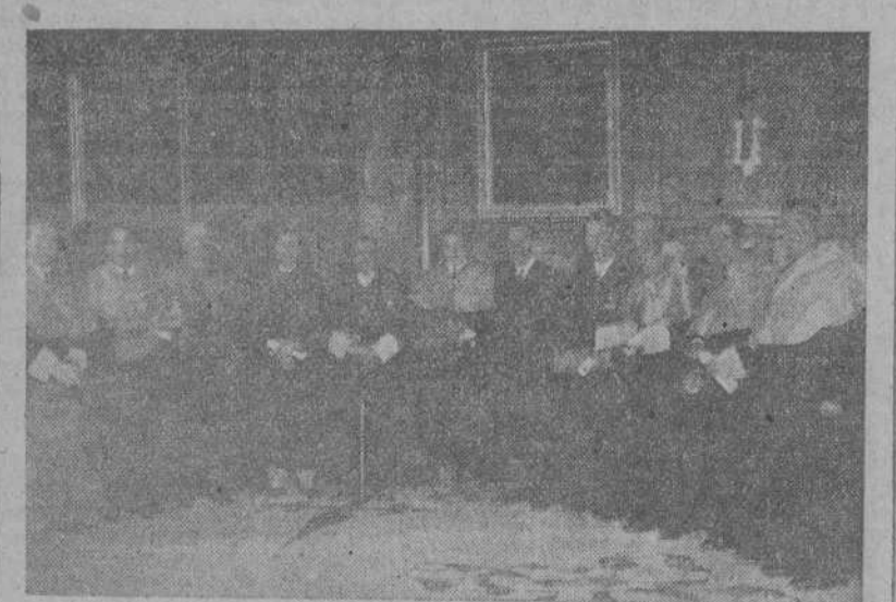
SANTIAGO.—Día del Licenciado.—Los alumnos más destacados de las cinco Facultades, con los padrinos y el Rector, después de haberle sido impuesta la Toza del Licenciado. (Foto Ariuro).

líneas ha sido confeccionada por Branglia, quien reemplazará a Cooké como ministro de Asuntos Exteriores en el Gobierno Perón. El periódico hace conjeturas acerca de que dichas relaciones queden establecidas antes del cuatro de junio para evitar que el proceso constitucional y parlamentario demorese el acuerdo, toda vez que si se promoviera después de que Perón asumiese el mandato presidencial, habría que someterlo a la consideración del Congreso, debido a que las anteriores relaciones con la U. R. S. S. fueron rotas por considerarse dañosas para el país.—(EFE).