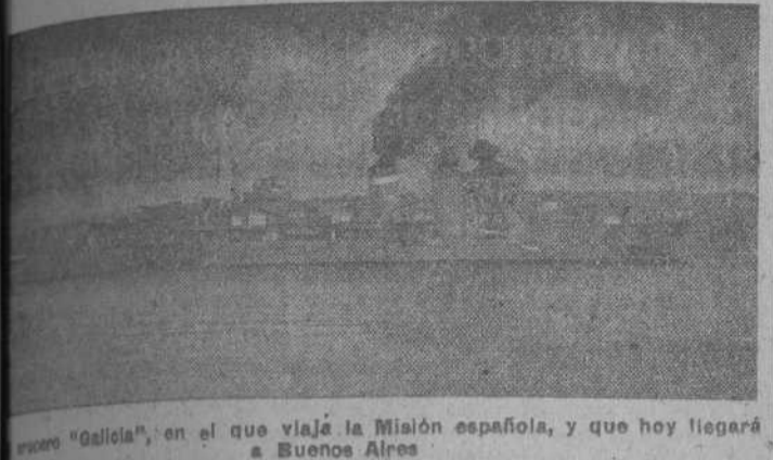
El crucero "Galicia", en el que viaja la Misión española, y que hoy llegará a Buenos Aires.

Hoy llegará a Buenos Aires la misión española a bordo del crucero "Galicia" Perón se ha reincorporado al Ejército argentino