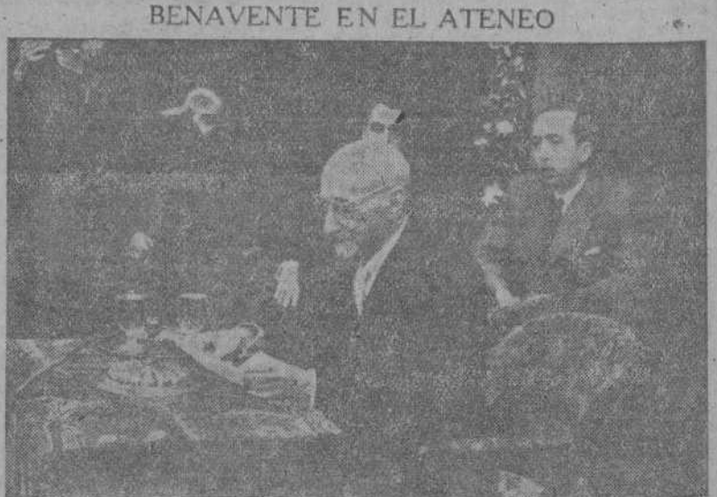
El insigne dramaturgo en un momento de su conferencia

DOCUMENTACIONES A PRESENTAR TARJETAS A-E (MEDICOS) H-I-K Y L. No se exige otra documentación que la tarjeta actual. TARJETAS E (TAXIS) G Y J. Los propietarios de camiones y taxis, deberán presentar la documentación completa del vehículo y Licencia Municipal en el caso de los taxis. Los petionarios de tarjetas "J" deberán acompañar la Declaración del Cuadro de Labores a realizar.