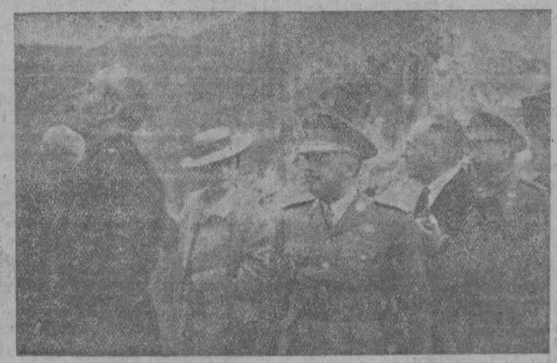
JAEN.—S. E. el Jefe del Estado, con su esposa y séquito, recorre las instalaciones del nuevo pantano del Tranco, segunda obra hidráulica de España después del Esla.