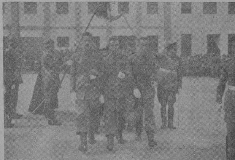
Ayer se celebró en los Cuarteles coruñeses la tradicional y solemne jura de la bandera por los nuevos reclutas. De dichos actos han sido captadas estas notas gráficas: la de arriba, en la Maestranza; la de abajo, en Artillería.