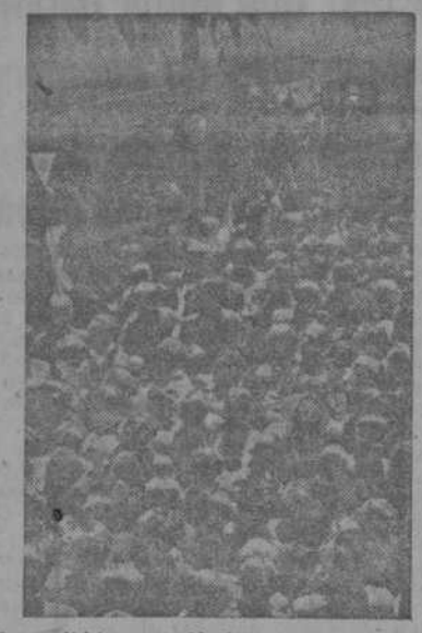
Es recibido entusiastamente al llegar a la capital, después de haber ganado el trofeo de S. E. el Jefe del Estado frente al Valencia en el Estadio de Montjuich.