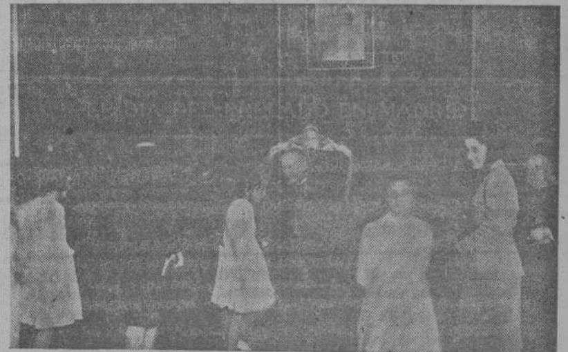
Con motivo del Día del Prelado, millares de madrileños desfilan por el Palacio Arzobispal para rendir homenaje al Obispo de Madrid-Alcalá, doctor Eijo Garay.