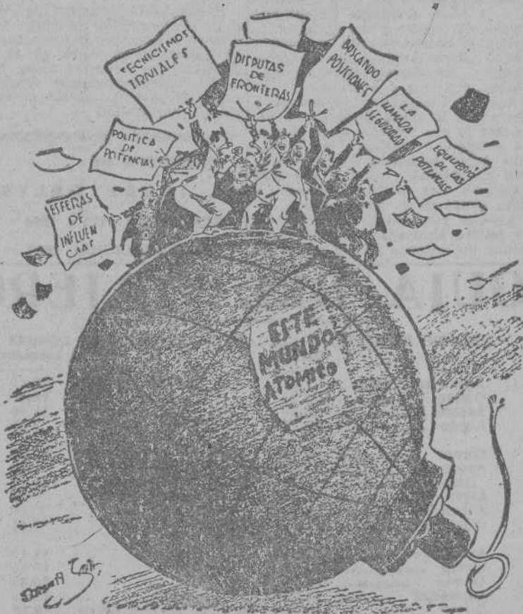
Parece una tentoria, ¿verdad?