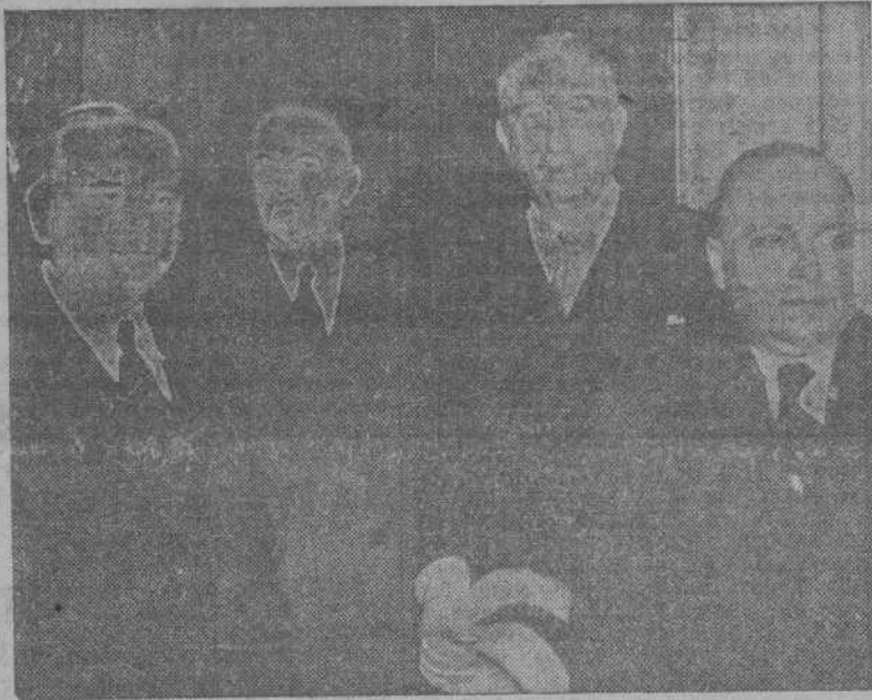
El político griego Tsaldaris (el primero, de izquierda a derecha) y algunos de los ministros que constituyeron el Gobierno después de las elecciones que dieron el triunfo a la Monarquía