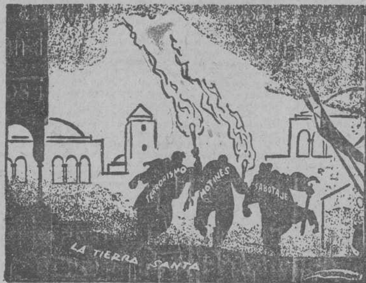
LOS TRES FORAJIDOS