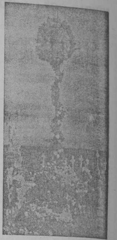
La Cruz de los Olvidados con las coronas y profusión de flores, que gentes piadosas colocaron en memoria de quienes no dejaron en este mundo familia ni amigos

MADRID, 1.—Los cementerios madrileños se han visto en la mañana de hoy completamente atestados de personas que acudían, siguiendo la tradición cosumbre, a depositar ramos de flores en las tumbas de los difuntos. En el cementerio de la Almudena se han visto singularmente honradas las tumbas de Calvo Sotelo y de los mártires del Alzamiento, en cuya memoria