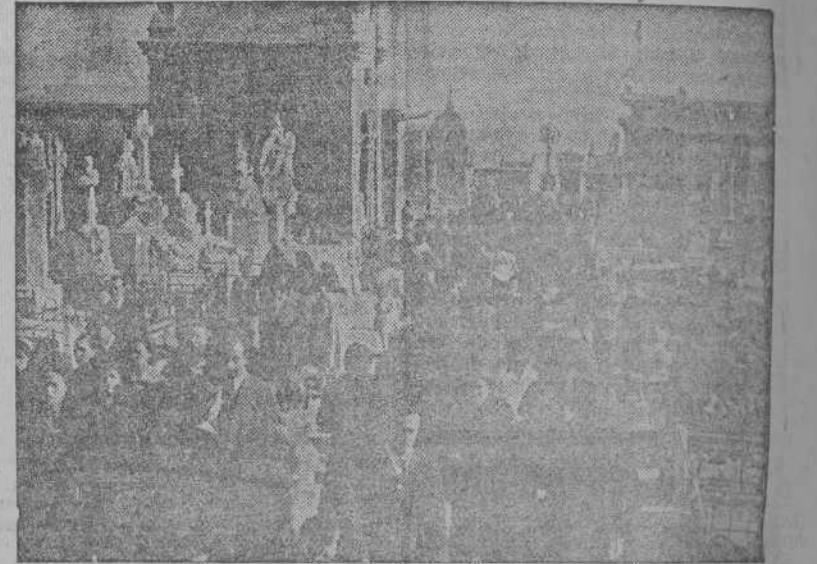
Aspecto parcial del Cementerio, invadido por la multitud que fué a rendir su tributo de oraciones y flores a los muertos

TARAZONA, 1.—El médico que atiende al Prelado ha manifestado al corresponsal de Cifra que el Obispo padece desde hace algún tiempo una afección de estómago, al parecer diagnosticada de cáncer con cardias con síndrome esofásico de evolución lenta y enfermedad grave. El sábado pasado hubo una consulta entre él y el doctor Auchá, de Pamplona, llegando a un acuerdo respecto al diagnóstico carcinoma de estómago, parte alta, que interesa el cordia y la parte baja del esófago.—(CIFRA).