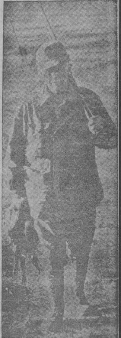
He aquí una foto poco conocida del general Marshall, sustituto de Byrnes en la Secretaría de Estado de los Estados Unidos. Marshall es un gran deportista, a pesar de sus 66 años.