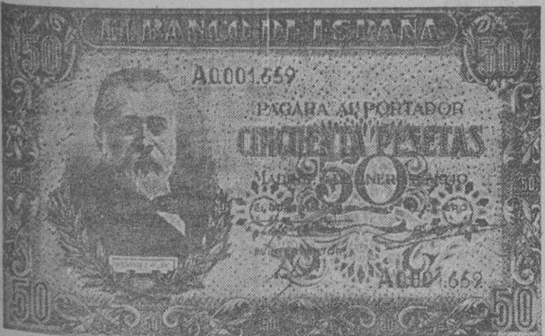
Anverso de los nuevos billetes de cincuenta pesetas que han sido puestos en circulación estos días por el Banco de España..