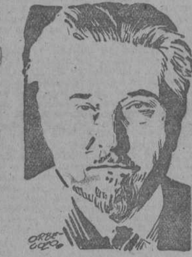
Paul Ramadier, jefe del Gobierno francés

La unificación del repertorio y de los aranceles viene siendo necesidad sentida hace años. Pensando en ello, el Ministerio encargó en abril de 1944 a los ingenieros jefe y subjefe del puerto de Pasajes la elaboración de un estudio encaminado a determinar la conveniencia de unificar las tarifas. El estudio terminó en febrero de 1945 y fue enviado a todos los ingenieros directores de los puertos de España, quienes informaron aportando multitud de observaciones y enmiendas que, una vez seleccionadas, fueron recogidas las más convenientes y redactada una nueva propuesta, que es la que ahora estudian los Plenos de las Juntas de Obras de los Puertos de España, una de las cuales, la del de La Coruña, lo estudió ayer y emitió su informe.