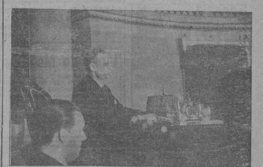
MADRID.—En el antiguo Palacio del Senado se celebró la reunión de la Asamblea Nacional Conservadora, en la que intervinieron unos 300 fabricantes de toda España. He aquí un aspecto durante la reunión.