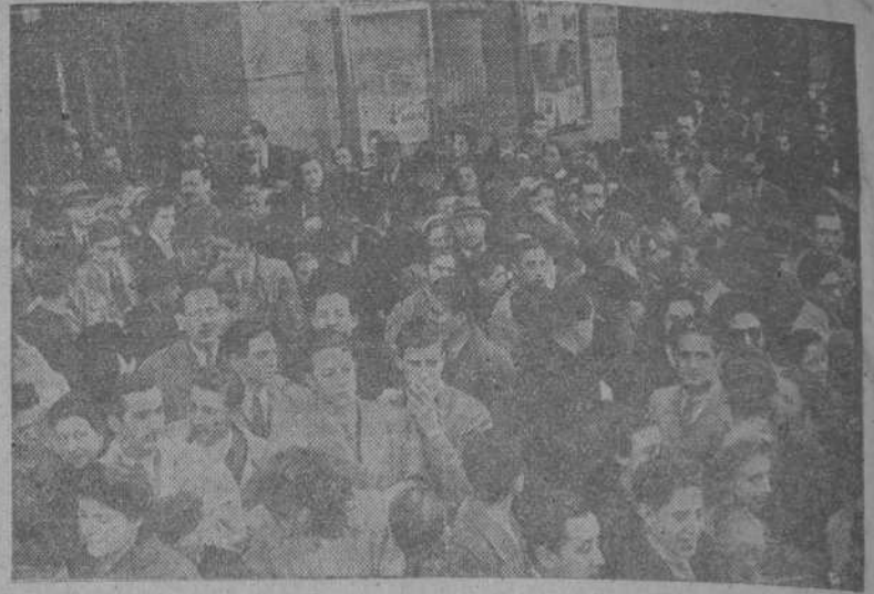
MADRID.—Vista de la puerta del Palacio de la Música, de Madrid, a la salida del Nuncio de S. S. y las personalidades que asistieron en el auto homenaje a S. S. el Papa, organizado por el Ministerio de Educación Nacional.

El Félix resulta también ser uno de los asesinos de otros guardias civiles en la calle de Batalla del Salado, el día 22 de enero último. Continúense sin descanso nuevas