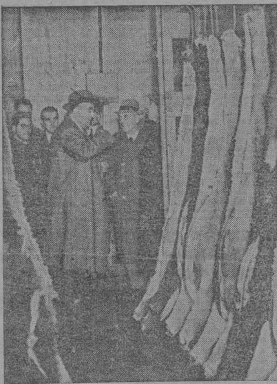
El Ministro de Industria y Comercio, señor Suanzes, durante su visita a los almacenes frigoríficos donde se guardan las carnes, frutas y verduras para el suministro a la capital de España.