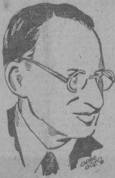
ALCIDE DE GASPERI

HANNOVER 13.—Los cristianos-demócratas se han negado a formar parte, en las actuales condiciones de la región del Gobierno, de Baja Sajonia. Se cree que el jefe social-demócrata, Heinrich Kopf, tratará de constituir Gabinete sin ellos.—EFE.