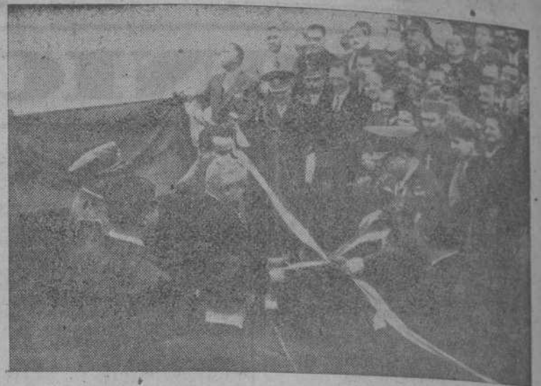
Un momento de la solemne ceremonia en que los Presidentes Perón y Dutra cortaron la cinta que inauguró el puente internacional del Paso de los Libres.

LONDRES, 31. — Winston Churchill ha perdido su popularidad entre la población inglesa en un 70 por ciento, en comparación con la época de la guerra, según una encuesta realizada por una empresa independiente. Parece que los ingleses consideran a Churchill como una especie de "monumento nacional" más que como candidato a dirigir la administración del país. La encuesta ha sido efectuada por el boletín de obsesión de las masas, correspondiente al mes de mayo. — (EFE).