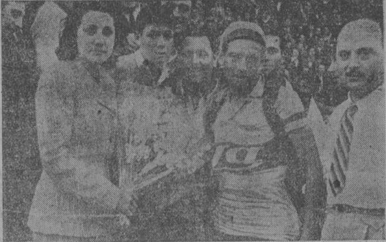
El "leader" de la Vuelta Ciclista a España en su séptima edición es premiado con un ramo de claveles

Y como el pelotón se acerca, dejamos a López Dóriga con su "blook", atento a la llegada de los "routiers".