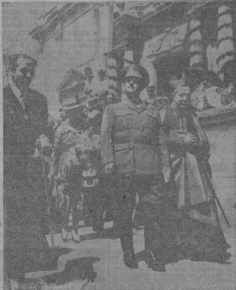
VICH.—S. E. el Jefe del Estado, acompañado del alcalde de la ciudad, sale de la Catedral, después de haber asistido a una solemne ceremonia religiosa.

En la Europa oriental se advierten movimientos de rebelión contra Moscú