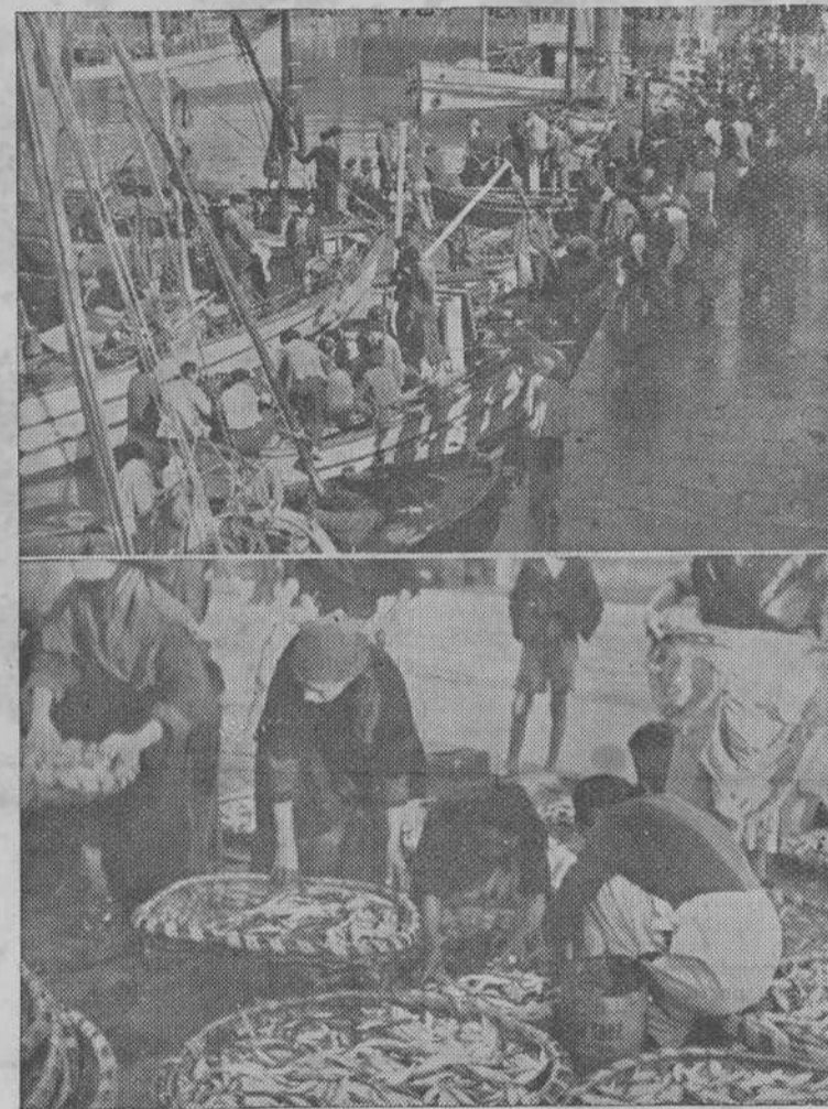
Faena típica del Berbés que acompaña a las faenas de los congresistas, los cuales la contemplan con cariñosa interés, como objeto de su afán constructivo