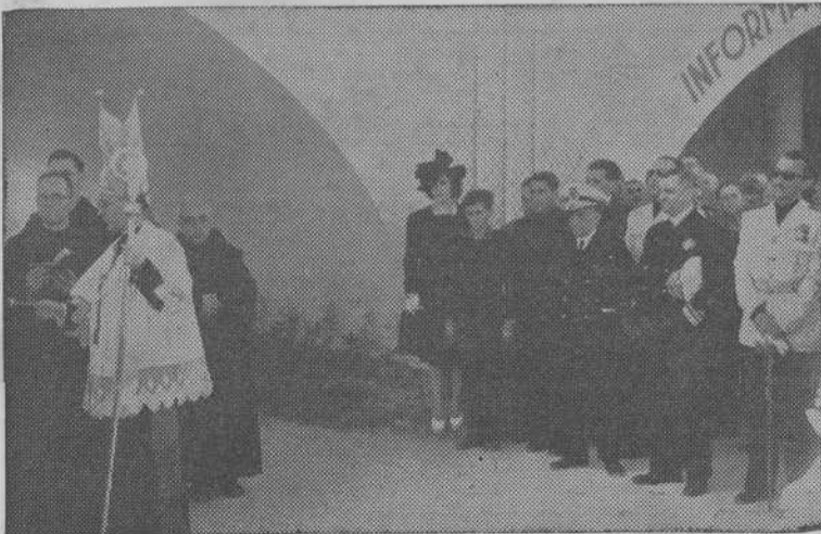
El Sr. Obispo con el Marqués de Valterra y el Sr. Gobernador en un momento de la bendición de los locales del Congreso Nacional de la Pesca

Por la Presidencia de la Comisión Ejecutiva del Congreso Nacional de la Pesca, se convoca a todos los camaradas Jefes de los Sindicatos Provinciales que se hallan en Vigo con motivo de la celebración del Congreso, a la reunión que presidida por el Jefe Nacional del Sindicato tendrá efecto a las cinco de la tarde del día de hoy, 18 de los corrientes, en el salón de Juntas del Congreso, piso primero del edificio de la nueva Lonja.