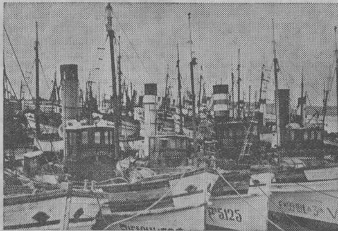
Detalle inspirador del escenario, donde los congresistas acoplan intereses y criterios a la grandeza de nuestro primer puerto pesquero