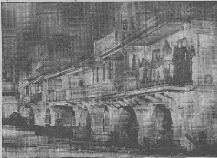
Contemplan los señores congresistas este Berbé de hace cincuenta años, embrión fecundísimo del Puerto Pesquero actual, donde ahora estudian los problemas nacionales de la pesca moderna