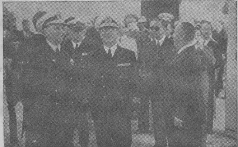
Las autoridades momentos antes de la inauguración del Congreso Nacional de la Pesca, con los huéspedes de honor portugueses