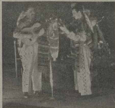
«Ecos del Plata» durante su actuación

sano y al mismo Jesucristo como tal trabajador, dignificando y enalteciendo el trabajo manual, antes considerado como la negación de las prerrogativas del ser humano, y estudiando el problema mundial del trabajo, demostrando como la justi-