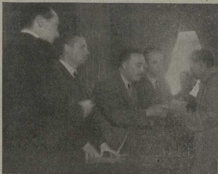
Entrega de donativos a artesanos y trabajadores de la Construcción y Madera

Gráficas RIAL IMPRENTA LITOGRAFIA CAJAS DE CARTON Cuba, 28 - Teléfono 2748 - VIGO