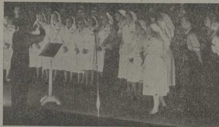
El Corp de Massó Hermanos que intervino en el festival de San José

No cabe duda que los organismos sindicales que, tienen por Patrón a San José, y que todos los años revisten los festejos en su honor, de gran esplendor, se han superado en el presente, siendo de justicia consignar la no pequeña parte que en brillantez han tenido los elementos pertenecientes al cuadro de Educación y Descanso, y al conjunto coral de la Empresa Massó Hermanos, a todos los cuales felicitamos por el éxito alcanzado.