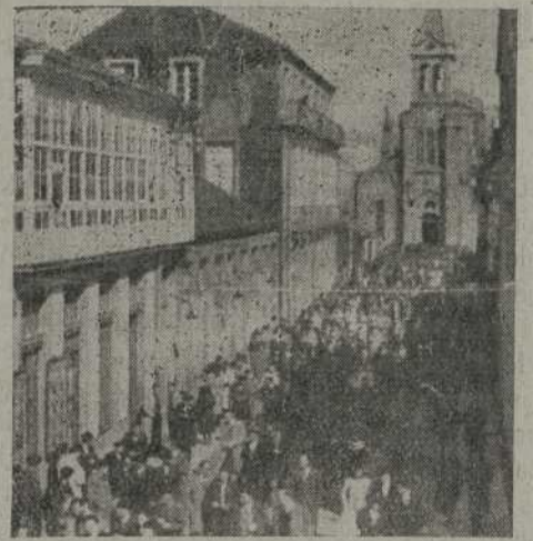
La Estrada. — Salida de la Misa con que se inició el homenaje del Santo Padre