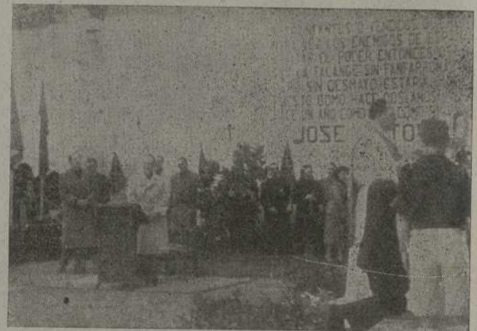
En el Teatro Villagarcía, se celebra el Santo Sacrificio de la Misa

nuestra primera autoridad civil de la provincia.