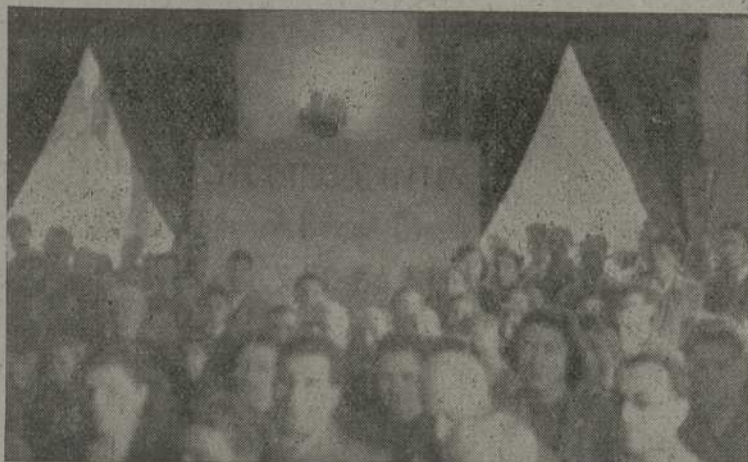
Caldas de Reyes. — Un aspecto del salón durante la retransmisión del radio-mensaje de Su Santidad

A todos ellos asistió numeroso público, entre el cual figuraban las familias de los fallecidos, y en el celebrado en Panjón, los niños acogidos en la Institución Huérfanos del Mar. Han revestido gran solemnidad y las Cofradías, han tomado el acuerdo de celebrar anualmente estos sufragios por el alma de aquellos, que en la lucha diaria rinden su vida al mar, interpretando así el sentido religioso de la gente pescadora.