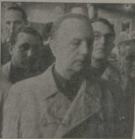
El ministro de Justicia inaugura la Exposición de Realizaciones del Movimiento

El Gobernador civil y Jefe Provincial del Movimiento, camarada Solís Ruíz, pronunció también un vibrante discurso