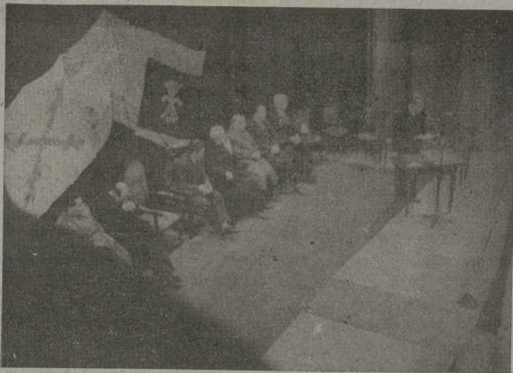
El Delegado Provincial de Sindicatos lee la alocución del Delegado Nacional

Terminado el Oficio divino, los asistentes se trasladaron al Teatro García Barbón y al Cine Rosalía de Castro. En ambos salones, que presentaban un austero, pero agradable aspecto, destacaban en diversos lugares y, alternando con banderas nacionales y del Movimiento, expresivas pancartas de los Sindicatos vigueses. En los escenarios, tenían lugar de honor, y sobre fondo de las banderas nacionales y del Movimiento, escudos del Papa en gran tamaño.