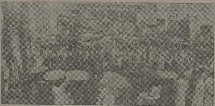
El público ante la Cruz de los Caídos, en la plaza de la Colegiata, a la terminación de los funerales celebrados en Vigo

Contribuid a la Campaña pro-Navidad de los humildes