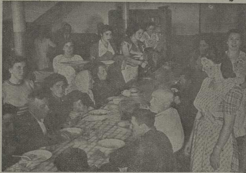
En las fiestas de la Virgen del Rosario de Villajuan, la Cofradía Sindical de Pescadores, dando pruebas del espíritu cristiano y de hermandad que preside los actos de la Organización Sindical, organizó una comida en obsequio de los trabajadores humildes de la villa

El grabado recoge un momento de este simpático acto de camaradería