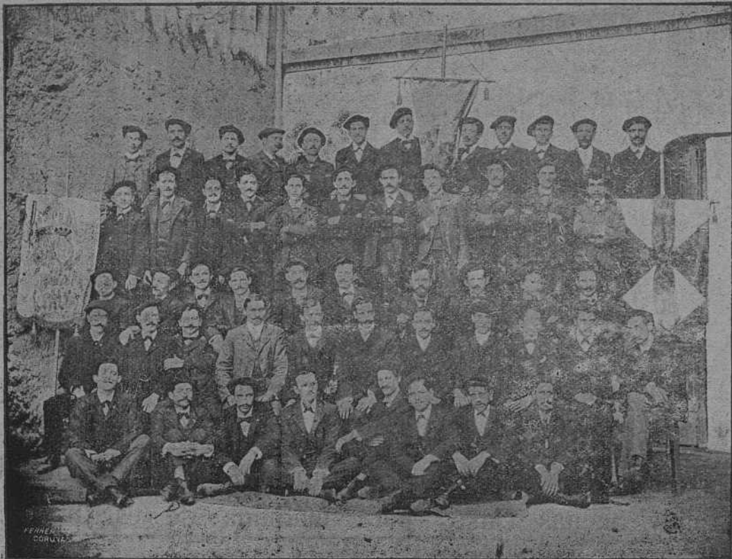
VIGO.-Orfeón «La Oliva».