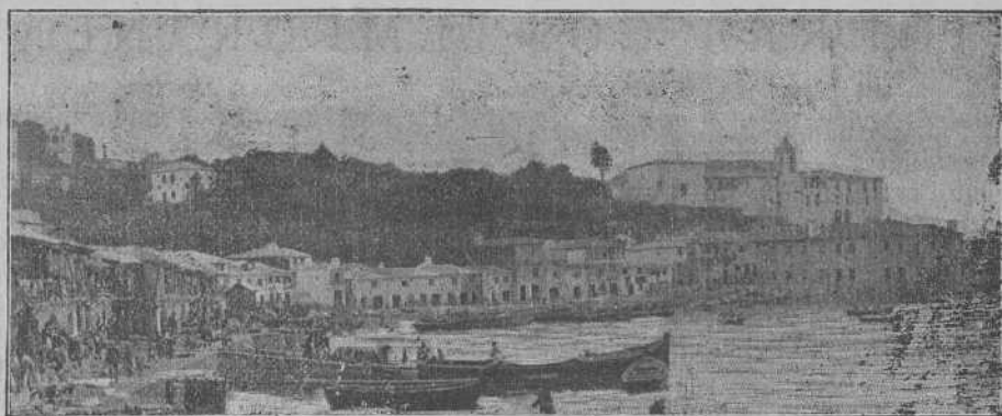
VIGO.-Rívera del Berbés.