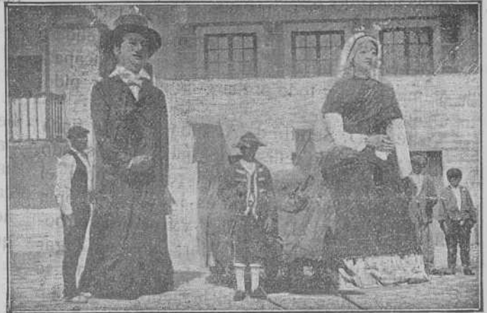
EL CORPUS EN REDONDELA--San Cristóbal y los gigantes.