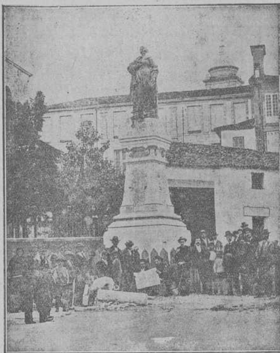
ORENSE.—Monumento a la eximia pensadora Concepción Arenal.